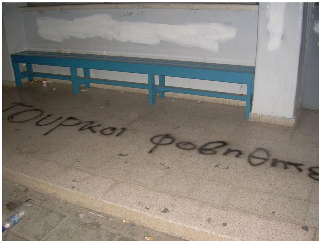
Βανδαλισμοί με συνθήματα κατά Τουρκοκύπριων μαθητών από ακροδεξιούς, στην Αγγλική Σχολή (English School) στη Λευκωσία, 2008.